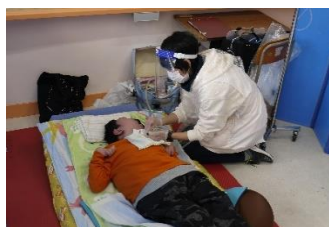
ケアルームの様子