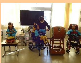
音楽・うたリズム