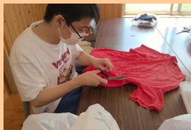
産業現場等における実習