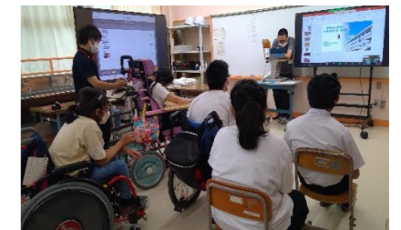
交流及び共同学習の様子