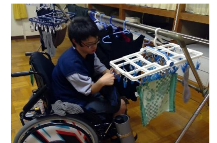
洗濯物干しの様子